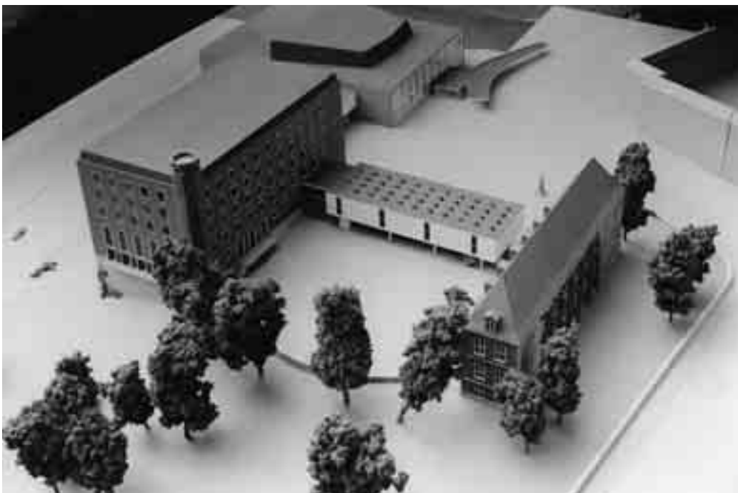
4 Modell der Neubauten, Blick von Nordwesten (Vogelperspektive). Rechts der so genannte Rantzaubau, in der Mitte die Historische Landeshalle, links der Neubau an der Stelle des Herzog-Adolf-Baus, darüber der Große Saal, die neue Konzerthalle.

Die Idee des Kulturzentrums war nicht neu, sie war unter nationalsozialistischen Vorzeichen schon einmal 1936 in einem städtebaulichen Wettbewerb durchdekliniert worden. 11 Bei einer Verwirklichung wäre das Gelände des Schlossgartens mit umfangreichen Neubauten für ein so genanntes Altgermanisches Museum zugestellt worden. 12 Letztendlich scheiterte das Vorhaben wohl an den Prioritäten der inten-