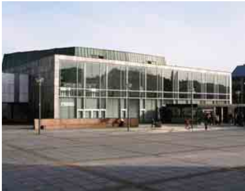
13 Der Große Saal von Nordwesten.

von ihm getrennt. 27 Jeweils vier schmale raumhohe Fensterbahnen an der Nord- und Südseite dienen neben zahlreichen Glaskuppeln im Flachdach der Belichtung. Die Landeshalle endet mit deutlichem Abstand vor dem historischen Westflügel, jedoch dicht genug, um einen Eindruck der früheren Dreiflügligkeit aufrechtzuerhalten.