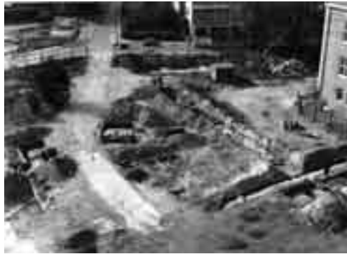
7 Grabung im Bereich des abgebrochenen Südflügels im Jahre 1960, Blickrichtung zur Schloßstraße.

Ostflügels in eine Neuplanung einzubeziehen [...]“. 19 Leider ist nicht überliefert, was Landeskonservator Peter Hirschfeld als ausgewiesener Streiter für die Schlösser und Herrenhäuser des Landes über diesen Fall dachte, jedenfalls akzeptierte er im Gegensatz zu seinem Vorgänger offenbar widerspruchslos die bis auf den Westflügel restlose Beseitigung der Ruine, denn auch der Granitquadersockel des Ostflügels wurde im Zuge der Baumaßnahme abgetragen, die mächtigen Blöcke für die Wiederverwendung zu Platten aufgesägt (Abb. 9). 19