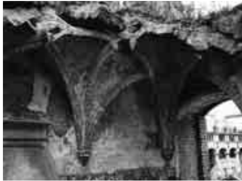
3 Reste der Netzgewölbe im nördlichen Saal des Erdgeschosses (Foto 1959).