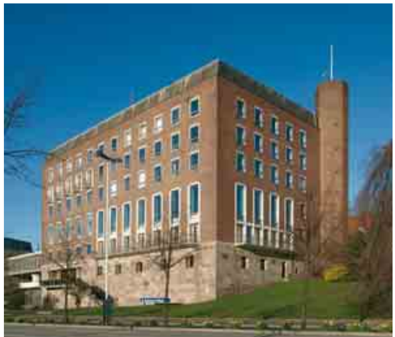
10 Das Hauptgebäude des neuen Kieler Schlosses von Nordosten.