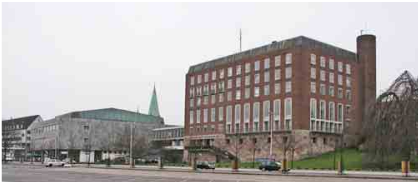
17 Gesamtanlage des Schlosses von Nordosten.

plätzen und Garagen sowie einer planlosen Mischung von Bauten aus den Nachkriegsjahrzehnten des vorigen Jahrhunderts mit häufig wechselnder Nutzung. Hier hat die Stadtplanung nicht nur restlos versagt, sondern durch die breit durchgezogene Eggerstedtstraße die Situation noch zusätzlich verschlimmert (Abb. 16). So war das Schlossgelände über einen viel zu langen Zeitraum von der Innenstadt abgekoppelt, Besucher von Veranstaltungen in den unterschiedlichen Sälen gelangen hauptsächlich über die Tiefgarage, also gewissermaßen aus dem Untergrund, in das Gebäude. Diese Isolierung übertrug sich auf das Gebäude selbst, das nie als städtebaulicher Höhepunkt der Innenstadt, sondern eher als Fremdkörper irgendwo hinter der Altstadt wahrgenommen wurde. Dabei genügt ein Blick von der Wasserseite, vom früheren Oslo-Kai, dem heutigen Ostsee-Kai, um die städtebaulichen Qualität der gesamten Gebäudegruppe noch heute kaum verfälscht wahrzunehmen und zu begreifen (Abb. 17).