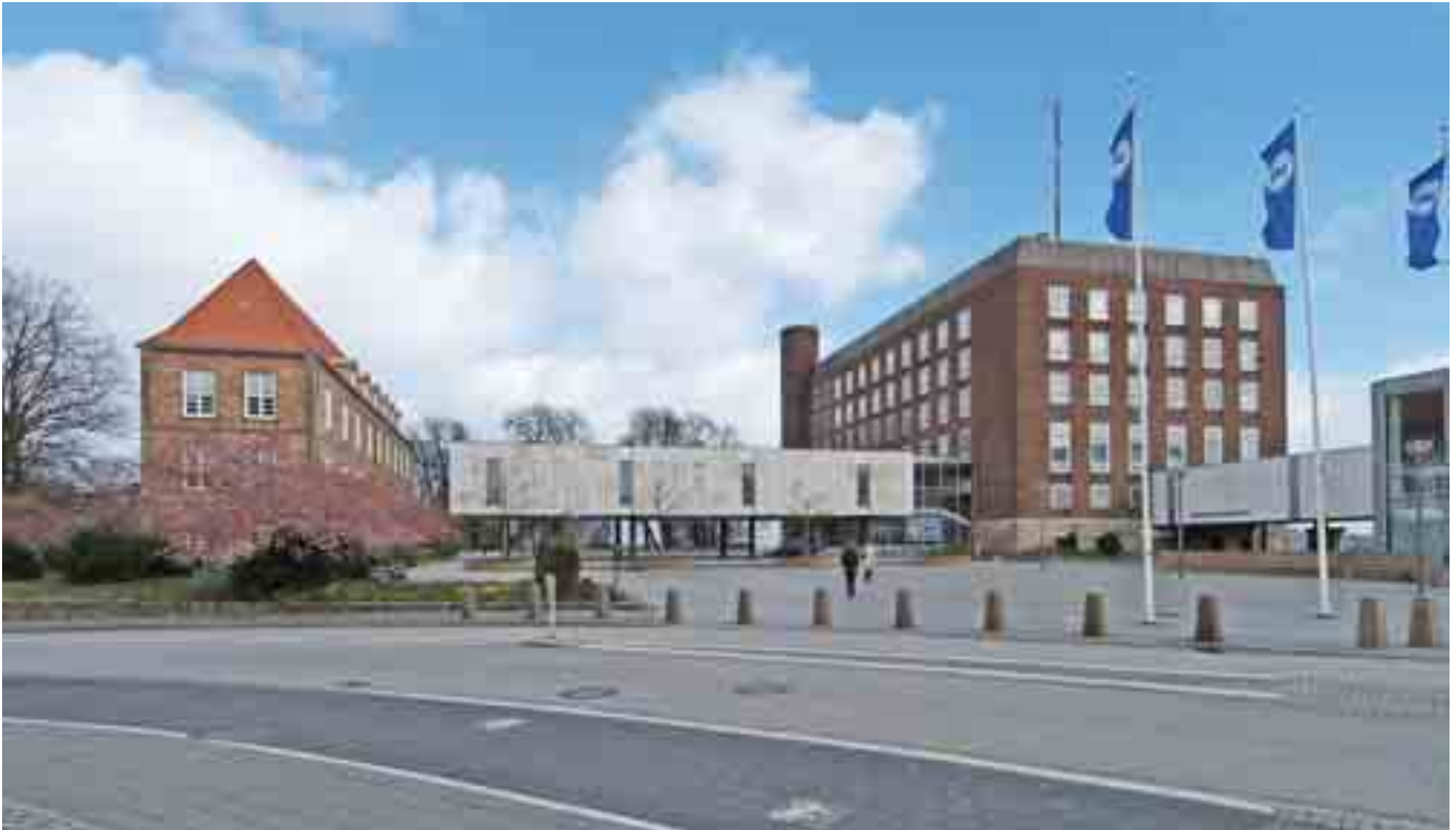
11 Schlossanlage von Süden. Links der so genannte Rantzau-Bau, in der Mitte die Historische Landeshalle, dann das Hauptgebäude mit der ursprünglich als Raucherfoyer genutzten Galerie und – angeschnitten – der Saalbau.

Die faktische Totalzerstörung der Kieler Altstadt ließ einige wenige erhaltene historische Fixpunkte gewissermaßen zu Dreh- und Angelpunkten des Wiederaufbaus werden. Neben dem Straßengrundriss aus der Gründungszeit waren das die ebenso alten Baugründe der Stadtkirche, des Franziskanerklosters und des Schlosses.