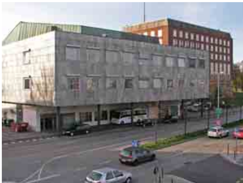
14 Der Große Saal von Südosten.

Ein ähnlicher Verbindungsbau, etwas höhenversetzt, erstreckt sich zwischen Hauptgebäude und dem südlich freistehenden großen Saalbau, auf den gleichen schlanken Stützen, von denen jedoch zwei ausgerechnet in der Mitte inzwischen mit überdimensionale Luftansaugstutzen bestückt wurden, die den Durchblick auf die Hafenszenerie empfindlich stören. Die westliche Rückwand dieser als Raucherfoyer deklariert