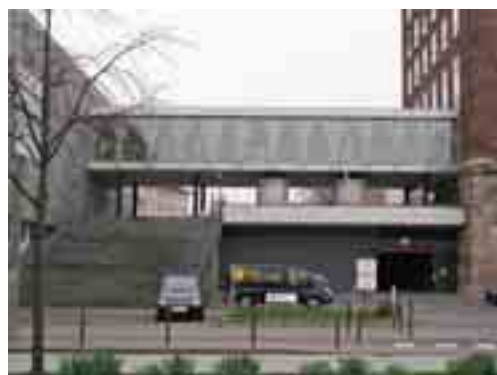
12 Die Galerie zwischen Saalbau und Hauptgebäude von der Wasserseite aus gesehen.

Das Hauptgebäude ist allerdings differenzierter zu betrachten. Die auf den ersten Blick nur im Westflügel des alten Pelli-Baus verwirklichte