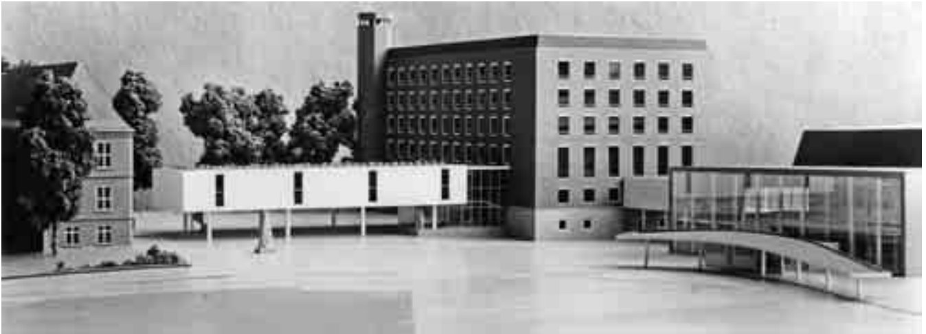
5 Modell der Neubauten, Blick von Südwesten. Der überdachte Zugang zum Saalbau wurde nicht verwirklicht.