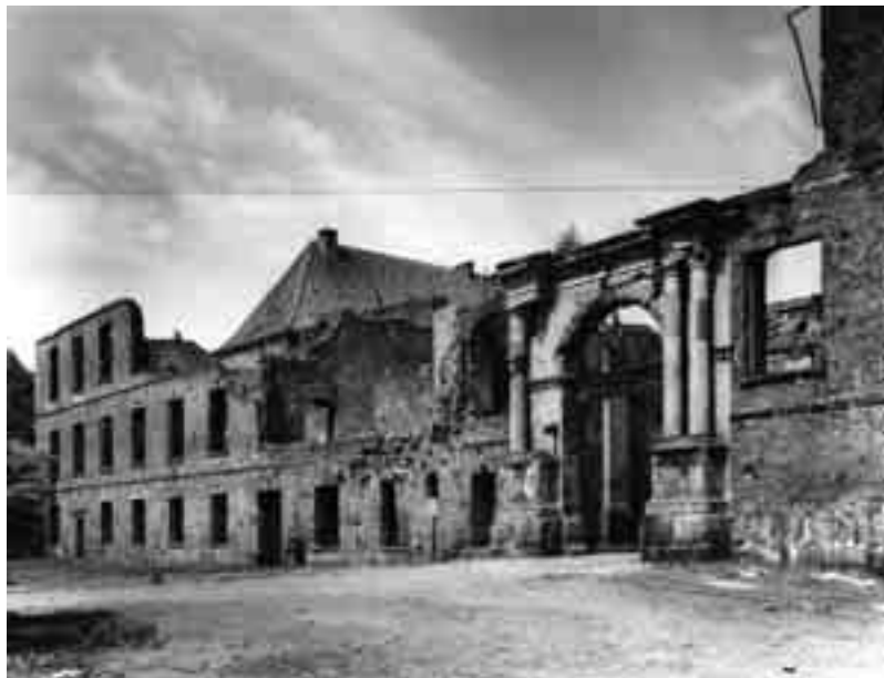
8 Der teilzerstörte Südflügel von Domenico Pelli mit dem Schlossportal von 1697 (Foto 1959).

So ist also nach damaliger Diktion und ebenso im seither entstandenen Bewusstsein, auch dem des heutigen Betrachters, das Schloss tatsächlich nur noch der neu aufgebaute Ostflügel. Der Rantzaubau, wie er immer noch fälschlich genannt wird, und auch die marmorverkleidete ehemalige Landeshalle, unter der heute der Haupteingang liegt, werden als Teile des Schlosses nicht wahrgenommen, die Landeshalle erscheint in der Konsequenz disponibel, was ganz nebenbei der oben erwähnte Workshop 2001 als fatales Ergebnis zeitigte, und der Westflügel als unscheinbares, aber sakrosank-