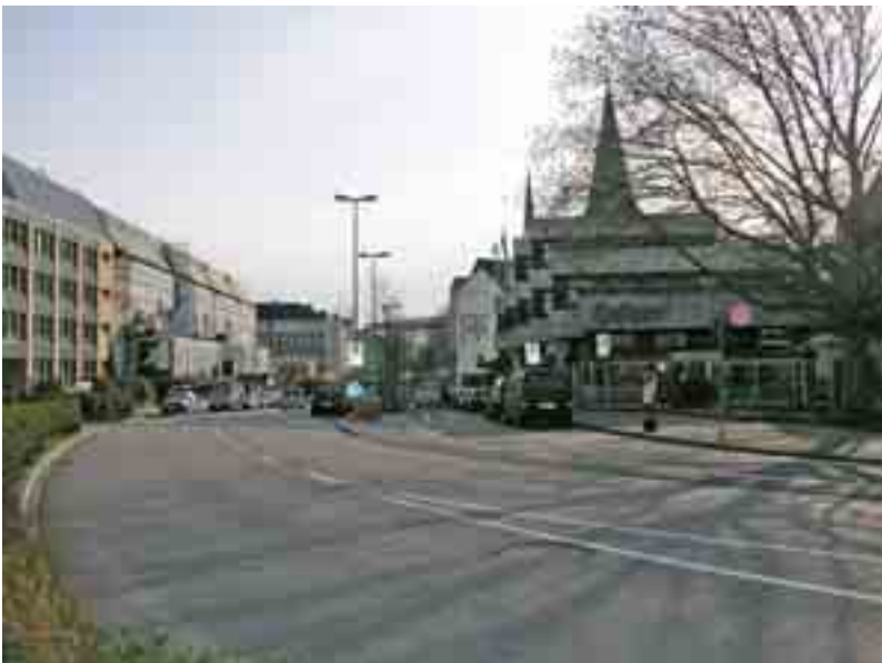
16 Blick vom Schloss in die nach dem Krieg in die Altstadt eingebrochene Eggerstedtstraße.

turalen Eindruck entstehen, der in reizvollen Gegensatz zu den rein kubischen Formen der anderen Bauten tritt. Die Last des weit über den Geländeang des Schlossvorplatzes vorkragenden Hauptbaukörpers, verstärkt durch die graugrüne Farbigekeit der Quarzit-Fassadenplatten, wird zum Wall auf das hier wiederkehrende leichtfüßige Säulenmotiv gestellt, das ihm optisch im Zusammenspiel mit dem weißmarmornen Hintergrund des Sockelgeschosses alle Schwere nimmt. Seine Fassaden sind zum Wall in gleichmäßiger doppelter Reihung durchfenstert (Abb. 14), zu den Seiten dagegen weitgehend geschlossen, während die Haupteingangsseite zum Schlossvorplatz wiederum vollkommen in Glas aufgelöst ist. Ein weiterer Farbklang, die grün patinierte Kupferdeckung des voluminösen Saaldaches, korrespondiert glücklich mit dem knapper gehaltenen Dach des Hauptgebäudes.