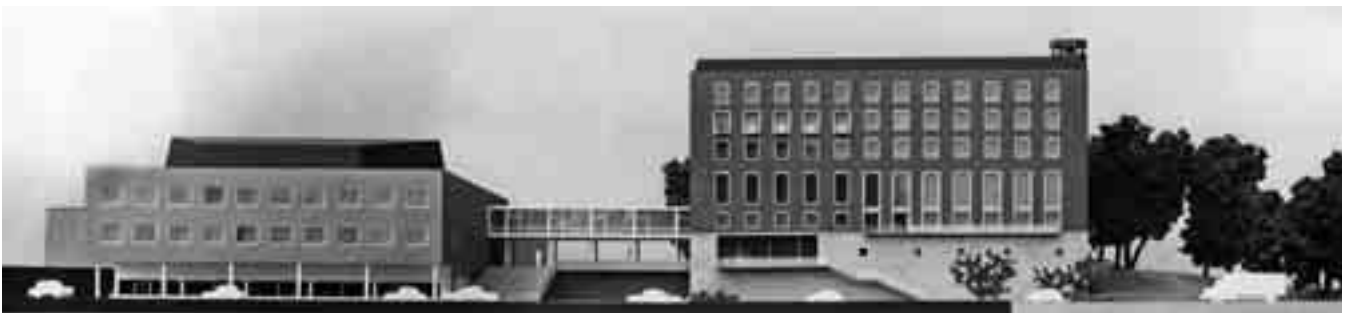
6 Modell der Neubauten, Blick von Osten, von der Wasserseite.

siven Kriegsvorbereitungen, die in Kiel den Werften- und Marine-Standort betrafen.